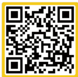
エントリーフォーム QR